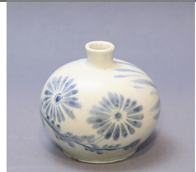
青花草花文壺 浅川巧旧蔵