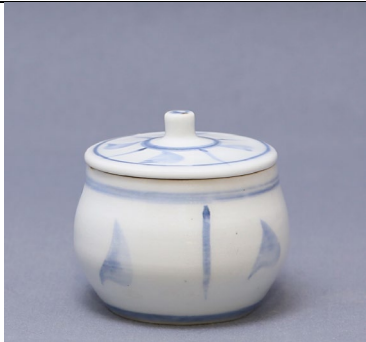
青花水草文蓋物 浅川巧旧蔵