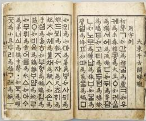
훈민정음 해례본 복제본