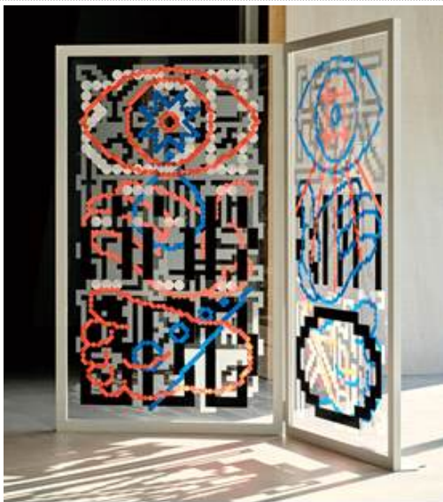
한HAN글文 이화영, 2022년 작