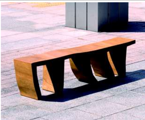
다섯 개의 기억 유정민, 2022년 작