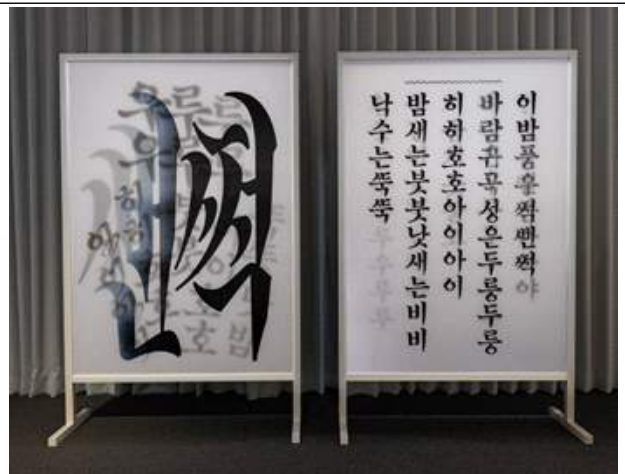
한글광상 김현진, 2022년 작