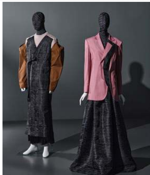
낮섬과 새로움, 그리고 연결 이청청, 2022년 작