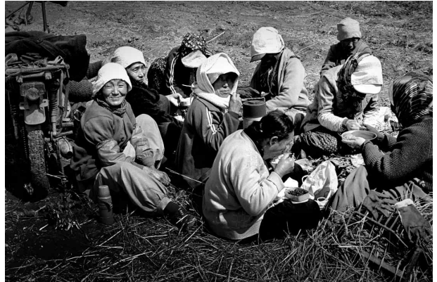
1978년, 후지모토 다쿠미작 김해평야(김해시)