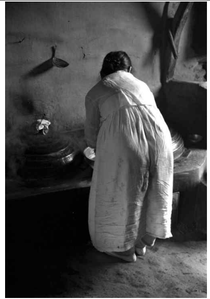
1973년, 후지모토 다쿠미작 석모도(인천광역시 강화군)