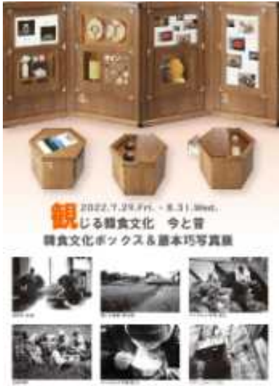
전시회 포스터 이미지