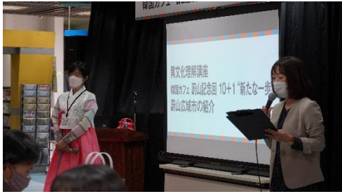
異文化理解講座（国際交流員）