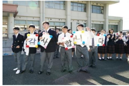
在学生たちの歓迎イベント

※イベント様子映像： https://youtu.be/Si8r91Gvckc (外部サイト)