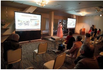
文化セミナー（国際交流員）