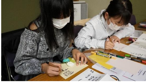
ハングルカリグラフィー教室